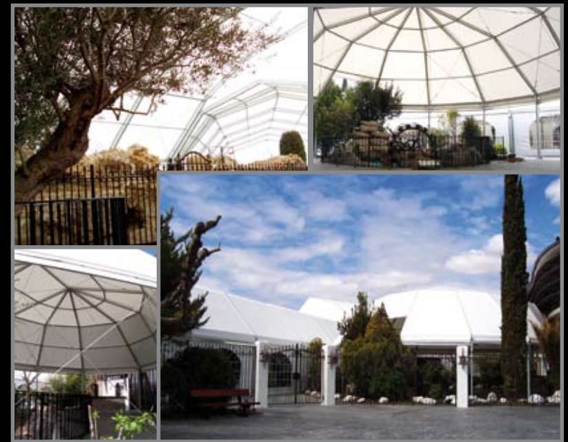
▶ Carpa poligonal de 11 mts. de pórtico, carpa poligonal ovalada y carpa irregular para el complejo hotelero Sella (Zaragoza).