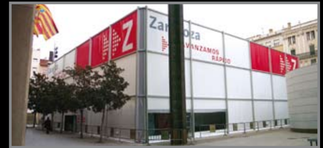
▲ Pantalla de cerramiento de 11 mts. de altura unida a carpa poligonal de 30 mts. de pórtico para el Ayuntamiento de Zaragoza. Esta estructura albergó, desde febrero a septiembre de 2007, en la plaza del Pilar la exposición "Zaragoza, Avanzamos Rápido" que se celebró con motivo de la Expo 2008.