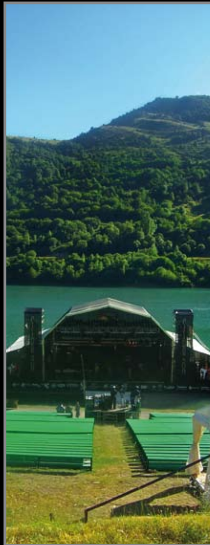
◀ Carpas y cubierta de escenario flotante para la Diputación Provincial de Huesca. Estas estructuras dan cobijo al Festival Internacional de las Culturas Pirineos Sur, que se celebra anualmente en Lanuza (Huesca).

E stos son algunos de los proyectos a medida que Aragonesa de Carpas ha diseñado y construido recientemente: