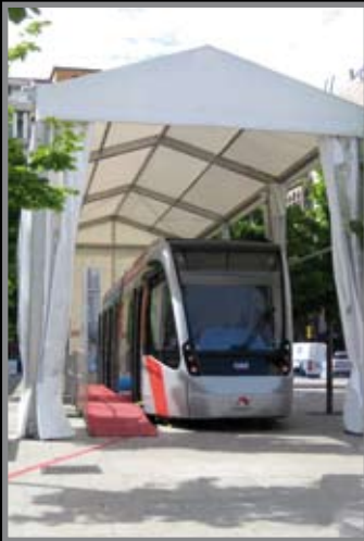
Carpa de 5 mts. de pórtico, 15 mts. de largo y 5 mts. de altura, con cierre fácil y cerramiento parcialmente transparente, muestra del tranvía de Zaragoza (Zaragoza).